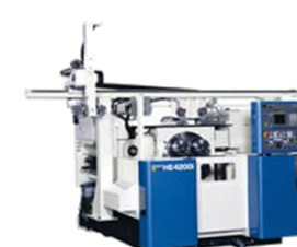
多軸NC旋盤(シマダマシンツール製)