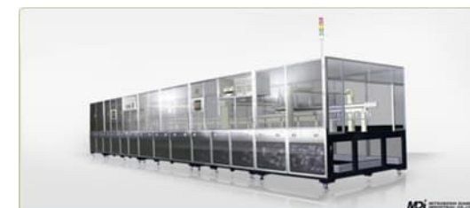
ライン機 第8世代(2000×2000)用 液晶パネル分断装置