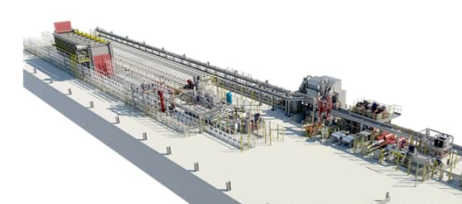
押出フルラインレイアウト

液晶基板ガラス分断装置分野において、世界のトップシェアを誇る、三星ダイヤモンド工業株式会社製品の販売代理店業務をコアに捉え、FPD(Flat Panel Display)業界向けの機器・資材を国内外の大手メーカーに供給しています。ガラス分断装置は、液晶TV、パソコン画面、携帯電話表示画面、カーナビ等多くの薄型表示用画面製造工程に導入されています。また、薄型表示用画面用ガラス以外の各種脆弱材料向けを中心に、高い精度が要求される分断や、直線以外の異形分断ニーズへの用途開発も進めています。