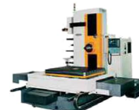
横中ぐりフライス盤(野村製作所製)

CNC旋盤は主に自動車産業向けの超量産部品の加工用として、横中ぐり盤はエネルギー産業向けに多数の実績がございます。米国においてはイリノイ州シカゴに販売拠点を設け、機械の据付・消耗品供給・修理等のアフターサービスまで対応、また欧州においても信頼できる現地パートナーと協業し、多様なお客様のニーズに対応しています。