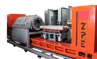
Z.P.E. マグネットヒーター