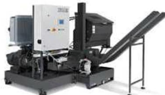
ブリケットマシン(独ルフ社製)